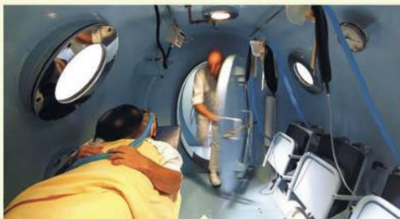
Dans une installation étanche, les patients sont soumis à une forte pression qui augmente l'oxygénation des tissus.

T out se passe dans un caisson pressurisé dit hyperbare (CHB), un équipement couramment utilisé pour traiter les intoxications au monoxyde de carbone ou les accidents de plongée. Les patients y respirent de l'oxygène à une pression plus élevée que celle de l'atmosphère. L'idée d'appliquer cette technique aux personnes souffrant de fibromyalgie revient à une équipe israélienne qui a publié ses résultats en 2015 dans la revue Plus One . Avec des résultats encourageants. Soit une nette diminution des symptômes douloureux chez une vingtaine de femmes ayant suivi 40 séances, cinq fois par semaine pendant deux mois. Tentés par cette approche, certains médecins français ont choisi à leur tour de tester ces caissons dans quelques centres (Lyon, Angers...). « Nous sommes allés voir des rhumatologues et des